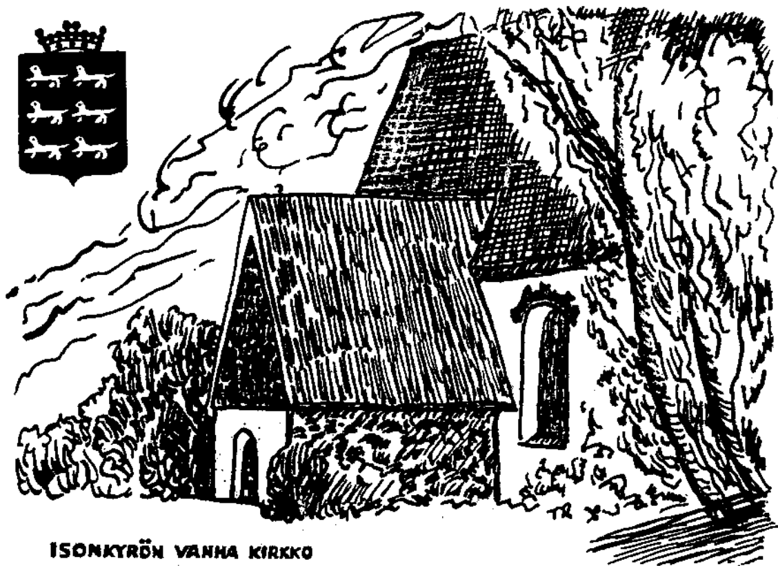
ISONKYRÖN VANHA KIRKKO